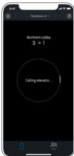
1. Nutzer ruft den Aufzug

Aufzugszuweisung: Nach dem Ruf – ob per Shortcut oder manuellem Ruf – wird der Name des zugewiesenen Aufzugs angezeigt, der für die Fahrt bereitgestellt wird.